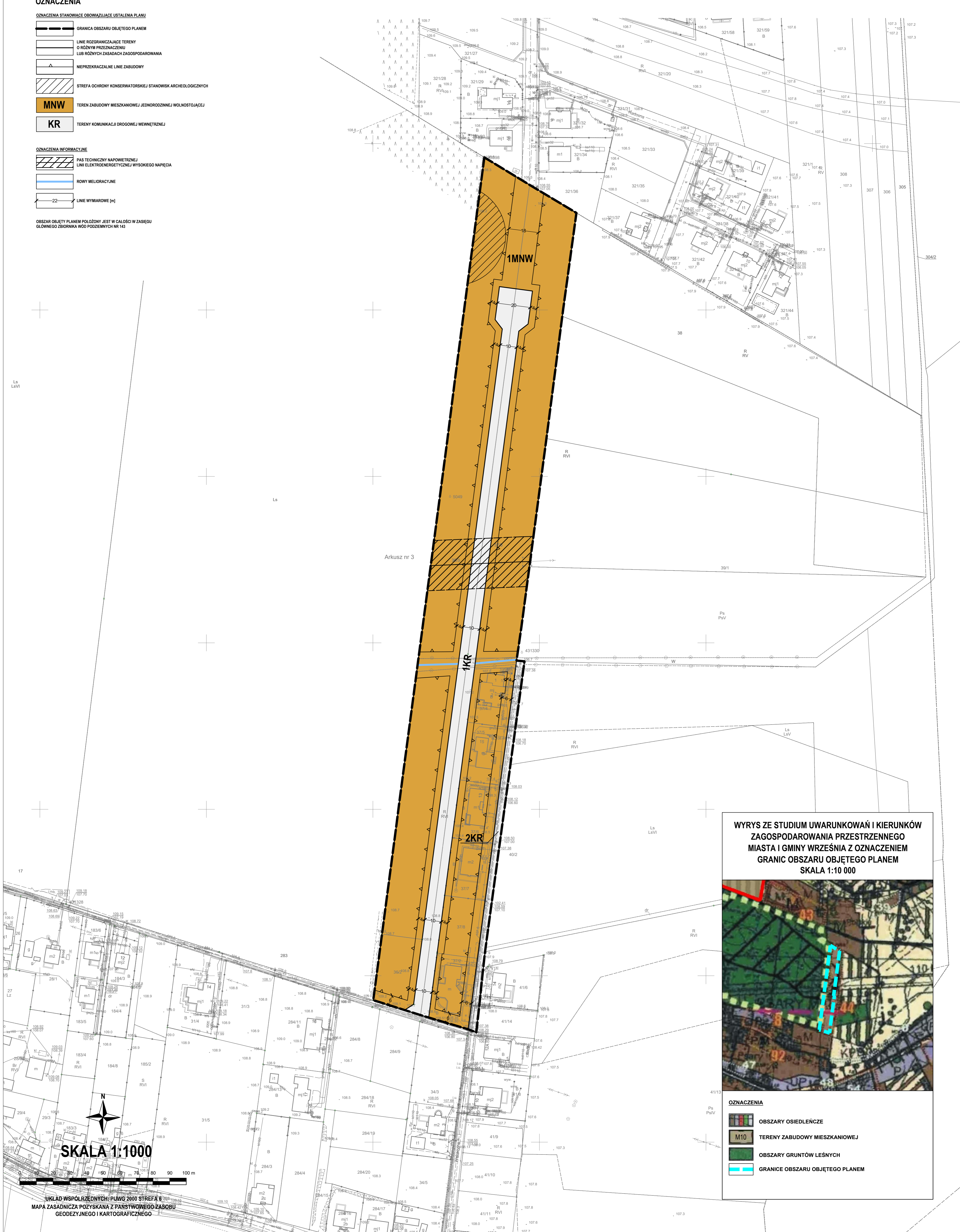
WYRYS ZE STUDIUM UWARUNKOWAŃ I KIERUNKÓW ZAGOSPODAROWANIA PRZESTRZENNEGO MIASTA I GMINY WRZEŚNIA Z OZNACZENIEM GRANIC OBSZARU OBJĘTEGO PLANEM SKALA 1:10 000

OBZAR OBJĘTY PLANEM POŁOŻONY JEST W CAŁOŚCI W ZASIĘGU GŁÓWNEGO ZBIORNIKA WÓD PODZIEMNYCH NR 143