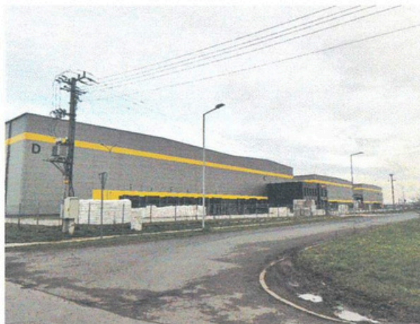
Układ komunikacyjny i zabudowania przemysłowe w rejonie strefy gospodarczej