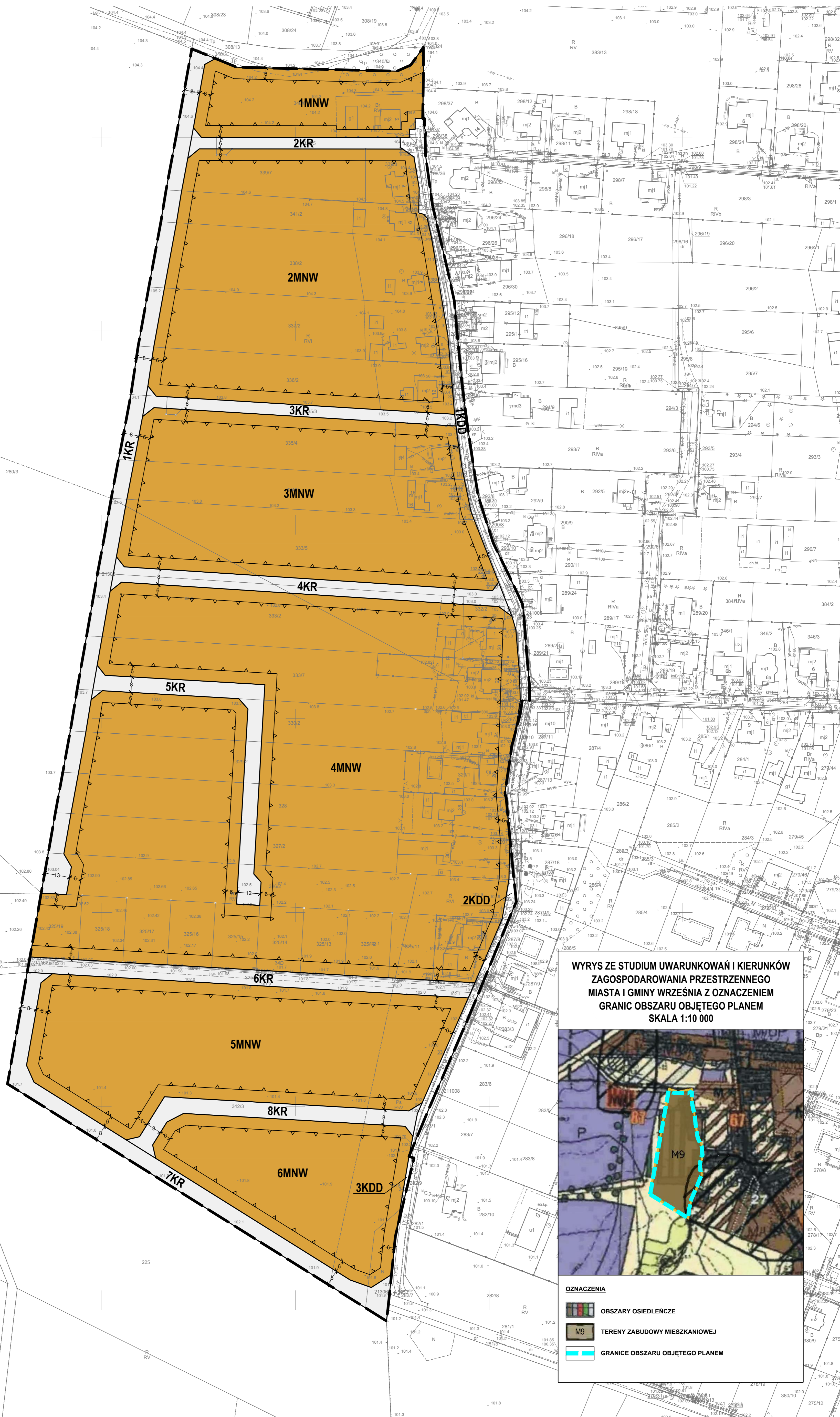
WYRYS ZE STUDIUM UWARUNKOWAŃ I KIERUNKÓW ZAGOSPODAROWANIA PRZESTRZENNEGO MIASTA I GMINY WRZEŚNIA Z OZNACZENIEM GRANIC OBSZARU OBJĘTEGO PLANEM SKALA 1:10 000

OBSZAR OBJĘTY PLANEM POŁOŻONY JEST W CAŁOŚCI W ZASIĘGU GŁÓWNEGO ZBIORNIKA WÓD PODZIEMNYCH NR 143