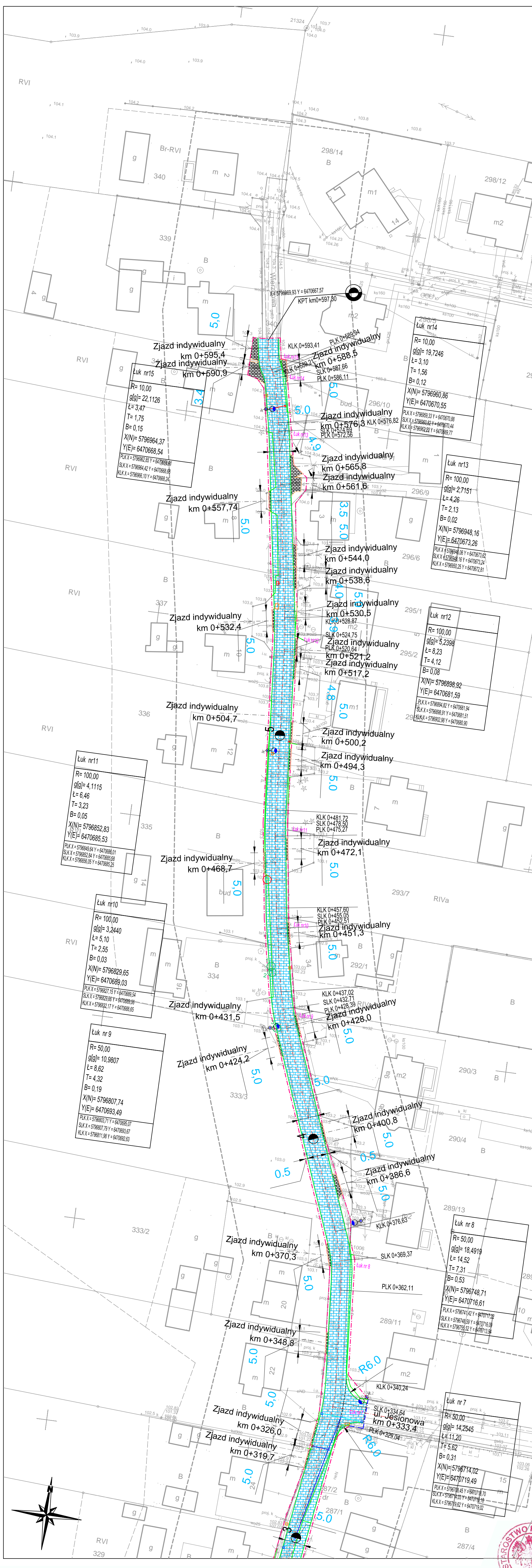
Mapa do celów projektowych Skala 1:500 NGK.6640.1250.2017