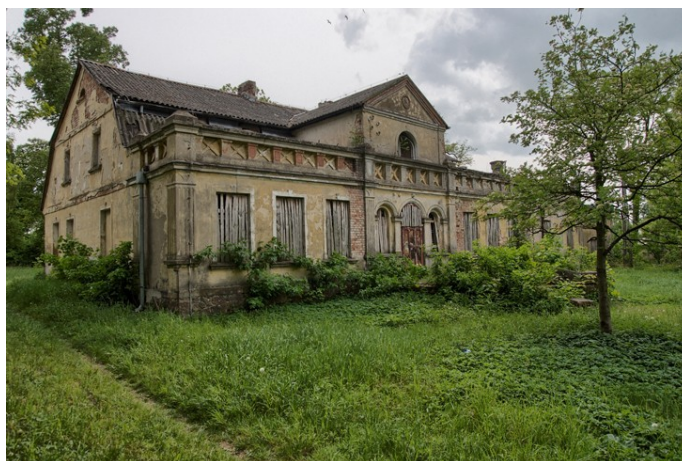
Ryc. 4 XIX-wieczny dwór w Bardzie.

Do rejestru zabytków wpisany jest dwór i otaczający go park. Dwór pochodzi z początku XIX w., natomiast w 1907 r. został rozbudowany. Posiada czterokolumnowy portyk i fronton z herbem Leliwa. Po zakończeniu II w. św. przejął go Skarb Państwa i od tej pory budynek jedynie niszczeje. Wraz z dworem stworzono park, obecnie mający powierzchnię ok. 6,85 ha.