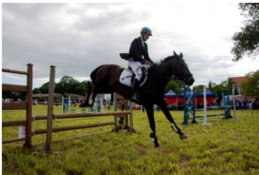
Ryc. 5 Zawody jeździeckie Bardo Cup.

Mieszkańcy miejscowości wykazują się sporą aktywnością, w czym wyróżnia się przede wszystkim sołtys Barda. Organizowane są zawody jeździeckie dla amatorów (w różnych kategoriach) czy plenery malarskie. Przy parafii działa klub sportowy dla młodzieży.