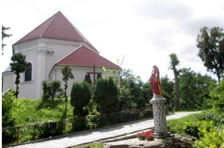
Ryc. 3 Kościół parafialny św. Mikołaja w Bardzie