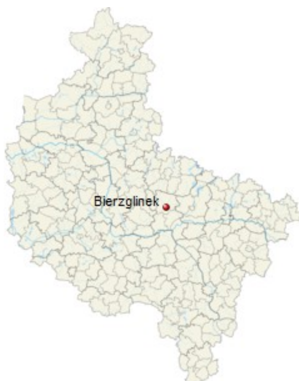
Rys. 1 Położenie Bierzglika na terenie województwa wielkopolskiego.

Wieś Bierzglinek położona jest w województwie wielkopolskim, w powiecie wrzesińskim, w gminie Września, przy trasie drogi wojewódzkiej nr 442 w pobliżu autostrady A2. Leży w bezpośrednim sąsiedztwie Wrześni. Bierzglinek połączony jest z Gozdowem nową drogą powiatową. Na terenie wsi znajduje się 17 ulic.