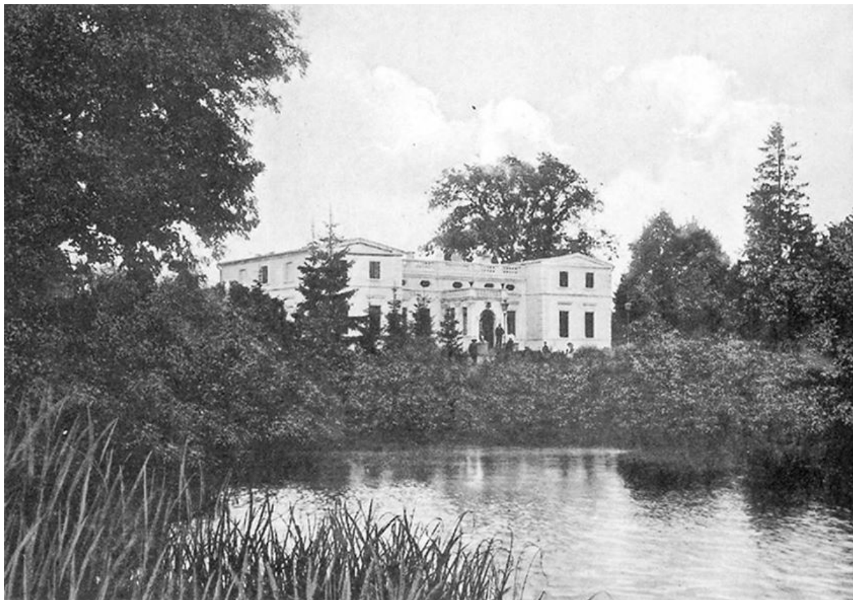
Ryc. 3 Dwór w Żernikach