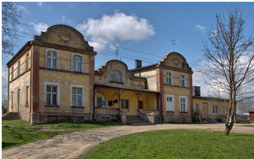
Ryc. 5 Dwór w Białężycach

W Chociczy Wielkiej znajduje się stacja bazowa telefonii komórkowej - jedna z 12 umiejscowionych na terenie gminy Września. W całym sołectwie zaś trwa budowa kanalizacji telekomunikacyjnej na potrzeby Wielkopolskiej Sieci Szerokopasmowej. Obie wsie są podłączone do sieci wodociągowej - Chociczę Wielką zaopatruje w wodę Stacja Uzdatniania Wody w Bardzie, natomiast Białężyce - SUW w Nowym Folwarku. Chocicza nie jest podłączona do sieci kanalizacyjnej.