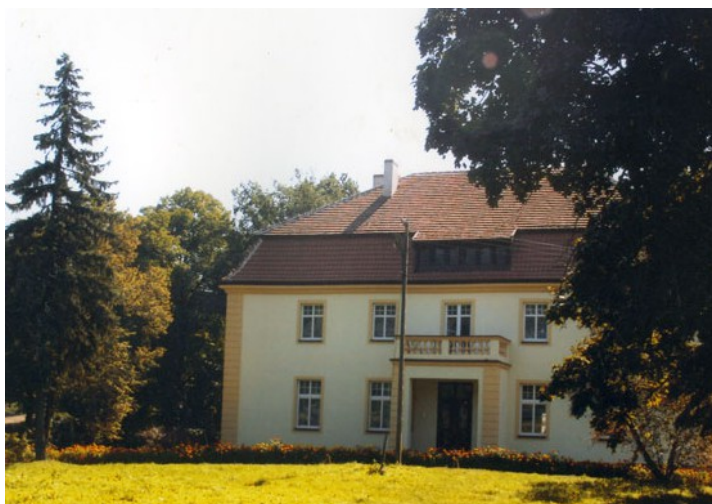
Ryc. 4 Dwór w Chociczy Wielkiej po remoncie

W 2003 r. dwór został wykupiony przez Państwa Obst. Po gruntownym remoncie założyli tam gospodarstwo agroturystyczne.