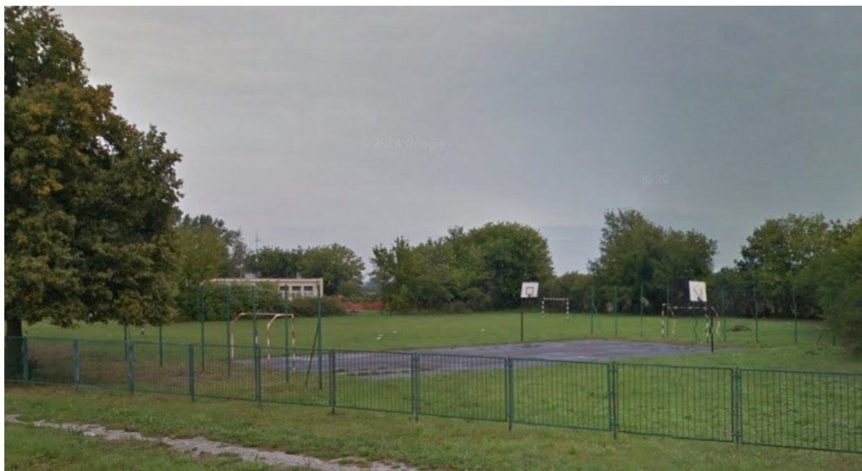
Ryc. 6 Boisko sportowe w Chociczy Wielkiej przy dawnej szkole podstawowej.

W Białężycach funkcjonuje Ludowy Zespół Sportowy, który dysponuje boiskiem. Mieszkańcy Chociczy mogą również korzystać ze świetlicy wiejskiej, w której m.in. organizowane są dla nich zebrania w sprawach ważnych dla wsi i gminy.