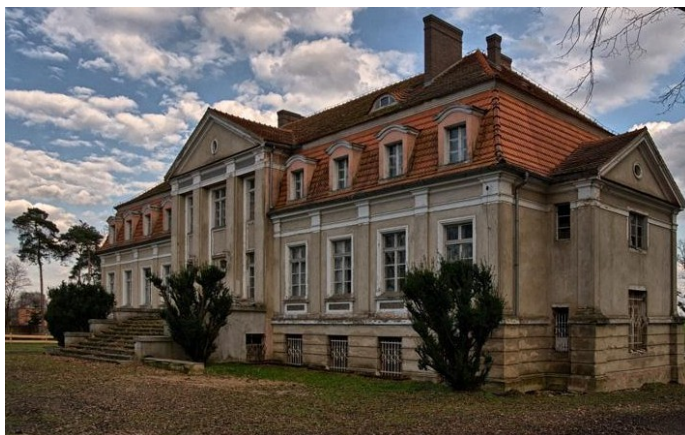
Ryc. 3 Dwór w Chociczy Wielkiej przed remontem