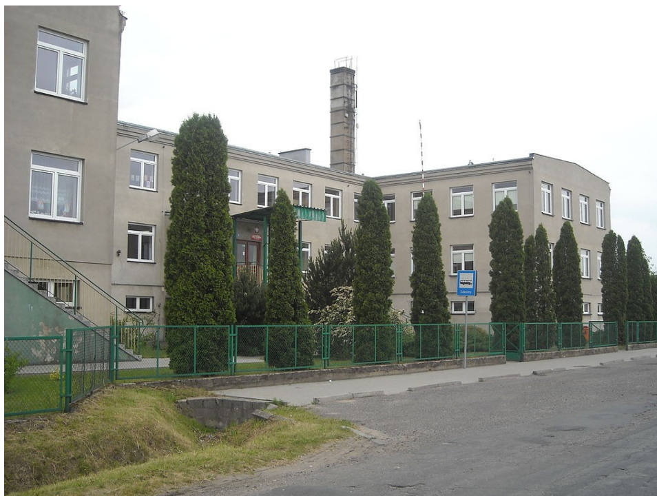
Rys. 1 Samorządowa Szkoła Podstawowa w Chwalibogowie.