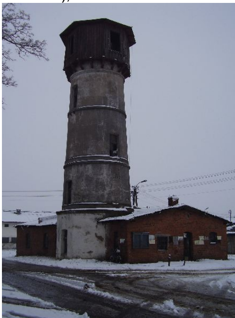
Ryc. 4 Wieża ciśnień