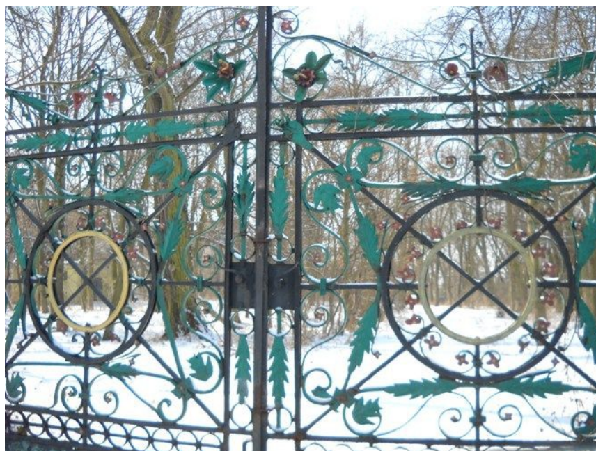
Ryc. 5 Park w zespole pałacowo-folwarcznym w Chwalibogowie