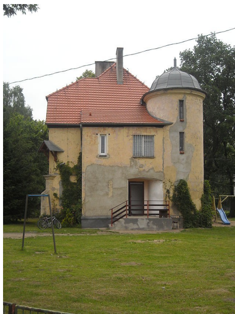
Ryc. 2 Budynek poczty (rządówki) w Chwalibogowie.