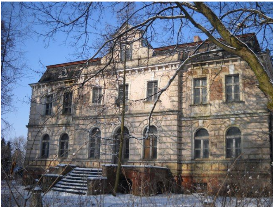
Ryc. 3 Pałac w Chwalibogowie.