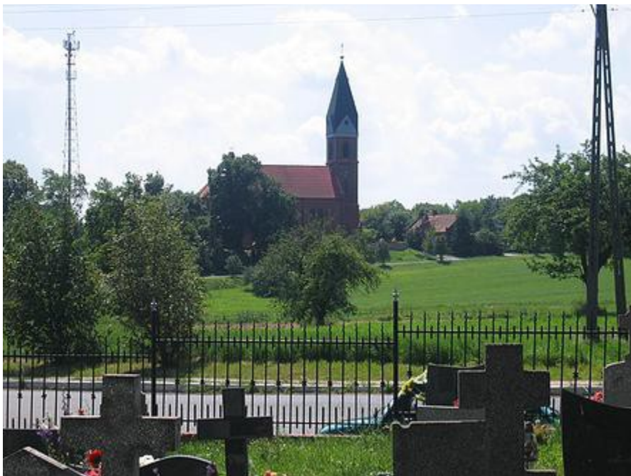
Ryc. 5 Kościół pw. św. Filipa i Jakuba w Gozdowie.

numerem: 343/Wlkp/A z 12.06.2006. Również 25 obiektów wyposażenia kościoła zostało wpisanych do rejestru zabytków ruchomych pod numerem 87/Wlkp/A z 31.05.2006 oraz 89/Wlkp/B z 7.03.2007.