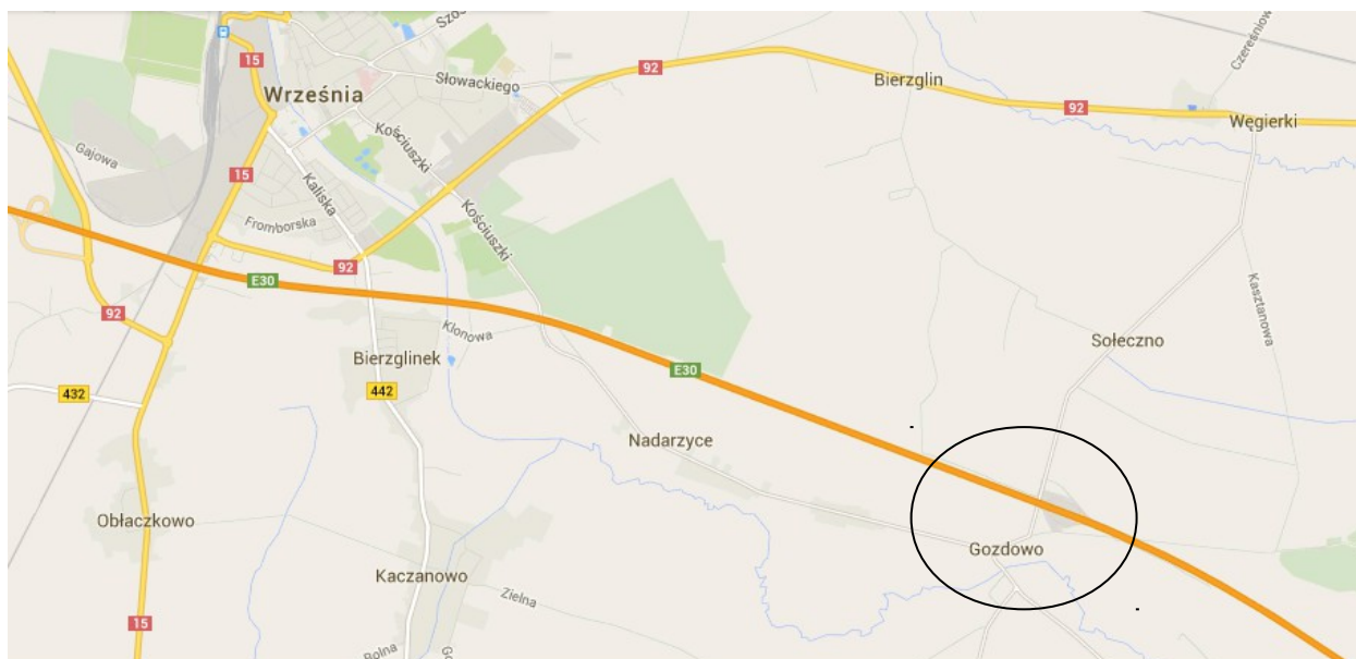
Ryc. 2 Położenie Gozdowa i Nadarzyć w gminie Września.

Miejscowość położona jest nad rzeką Wrześnicą Małą (dla odróżnienia od rzeki Wrześnicy, stanowiącej prawy dopływ Warty). Utrzymanie rzeki to zadanie Wielkopolskiego Zarządu Melioracji i Urządzeń Wodnych, który zresztą w 2014 r. prowadził na rzece prace obejmujące m.in. wykoszenie skarp, porostów z dna, usunięcie kożucha roślin pływających oraz zatorów z gałęzi. W XV w. Jan Długosz określił tę rzeczkę łacińskim mianem Fluvius , co oznacza rzekę spokojną. Płyne ona spod Gniezna w kierunku Pызdr. W 2011 r. Wielkopolski Zarząd Melioracji i Urządzeń Wodnych miał przystąpić do budowy zbiornika retencyjnego na Wrześnicy w Gozdowie. Udało się uzyskać na ten cel środki finansowe z Programu Rozwoju Obszarów Wiejskich na lata 2007-2013. Poza gromadzeniem wody dla rolników oraz zapobieganiem powodziom, zbiornik miał być wykorzystywany również w celach rekreacyjnych. Przewidziano, że jego powierzchnia wyniesie ok. 22 ha, głębokość - 2 m, zaś zaporę czołową miała zostać umiejscowiona powyżej drogi gminnej łączącej drogę powiatową z Gozdowem Młynem. Pojawił się jednak problem ze sprzedażą terenów wykorzystywanych obecnie jako łąki na tę inwestycję. Inwestor opracował również projekty, które „przesuwały” zbiornik w inne miejsce, jednak wówczas zalaniu uległyby domy i zabudowania gospodarcze w pobliżu mostu. Obecnie na rzece organizowany jest element Maratonu Turystycznego „Nad Wartą Ziemi Wrzesińskiej”,