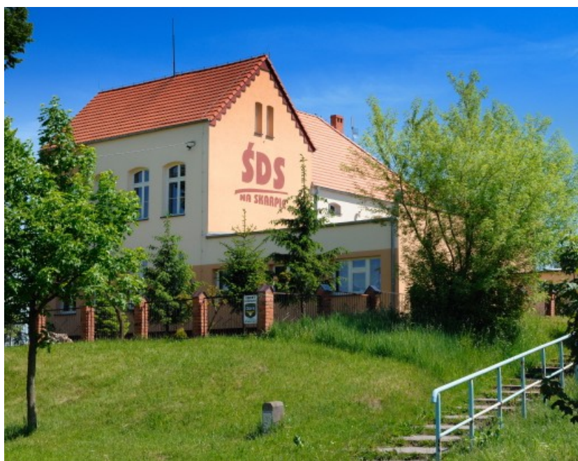
Ryc. 7 Środowiskowy Dom Samopomocy „Na Skarpie” w Gozdowie.

W Gozdowie mieści się Środowiskowy Dom Samopomocy „Na Skarpie” (dawniej budynek szkoły podstawowej). Miasto i Gmina Września udostępniła dwupiętrowy budynek na prowadzenie ŚDS przez Powiatowe Centrum Pomocy Rodzinie. Działa on od marca 2006 r. jako dom pobytu dziennego dla osób z zaburzeniami psychicznymi, które ukończyły 16 lat. Mają one możliwość pracy w kilku pracowniach: plastyczno-introligatorskiej, stolarsko-ogrodniczej, gospodarstwa domowego, krawieckiej, komputerowej i rękodzieła artystycznego. Może w nim przebywać 37 pacjentów.