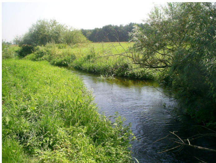
Ryc. 3 Rzeźnica Mała

który obejmuje konkurencje rowerowe (30/45 km), kajakowe (10/15 km) i piesze (10/15 km).