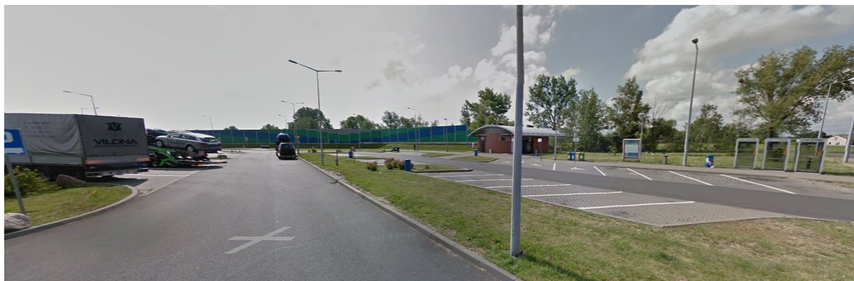
Ryc. 4 MOP Gozdowo