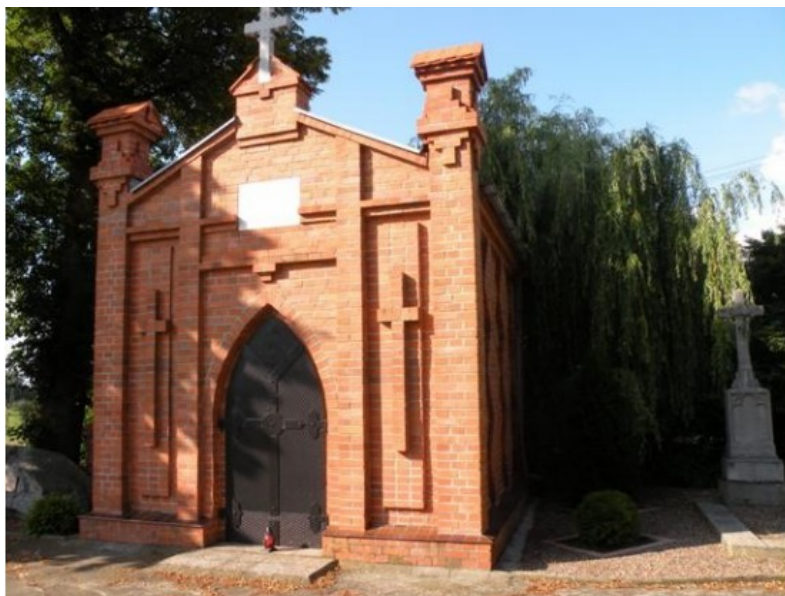
Ryc. 6 Grobowiec K. Grodzielskiego w Gozdowie.

Powstańczym. W styczniu 1994 r. odbyły się w Gozdowie uroczystości religijno-patriotyczne, zakończone poświęceniem grobowca.