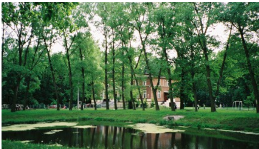
Ryc. 4. Park przy dworze w Gutowie Małym.

Zdecydowaną część powierzchni Gutowa Małego – 486,49 ha (88%) - zajmują grunty rolne, w tym orne (460,25 ha), pastwiska (17,99 ha) oraz sady (8,25 ha). Ponad 16 ha stanowią tereny zielone, tzn. lasek Dąbrówka, park i boiska. Park ma powierzchnię 6,25 ha i od 1975 r. wpisany jest do rejestru zabytków. Rosną w nim lipy, dęby, kasztanowce, klony, jesiony, wierzby, topole; mniej licznie reprezentowane są sosny, świerki i akacje.