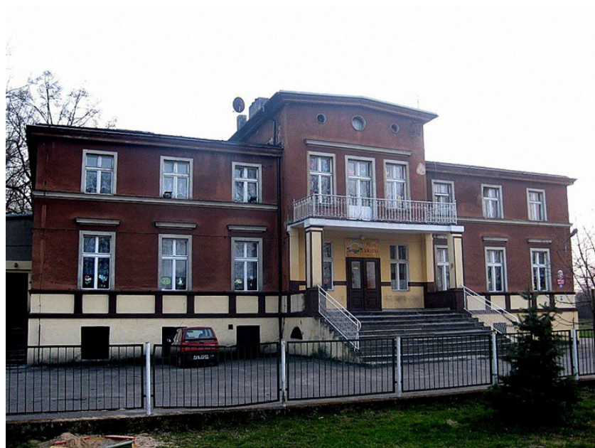
Ryc. 2. Dwór z XIX w. w Gutowie Małym.

Gutowo Małe to wieś o powierzchni 552,06 ha, zamieszkiwana przez 698 osób (dane z 2013 r.). Od wrześni jest oddalona zaledwie o ok. 6 km, co czyni z niej wieś o podmiejskim charakterze.