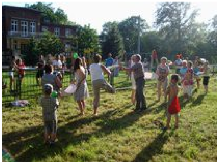
Ryc.6. Festyn rodzinny „Mama, Tata i ja”, 2014 rok.