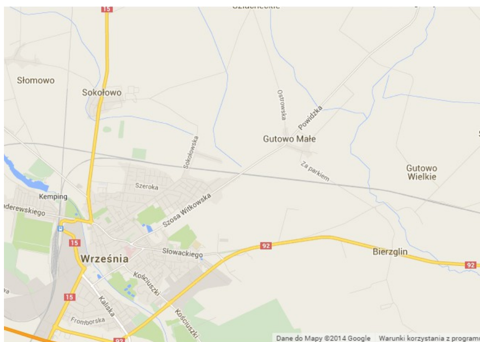
Ryc. 3. Położenie Gutowa Małego względem miasta Września.

Gutowo Małe to wieś o powierzchni 552,06 ha, zamieszkiwana przez 698 osób (dane z 2013 r.). Od wrześni jest oddalona zaledwie o ok. 6 km, co czyni z niej wieś o podmiejskim charakterze.