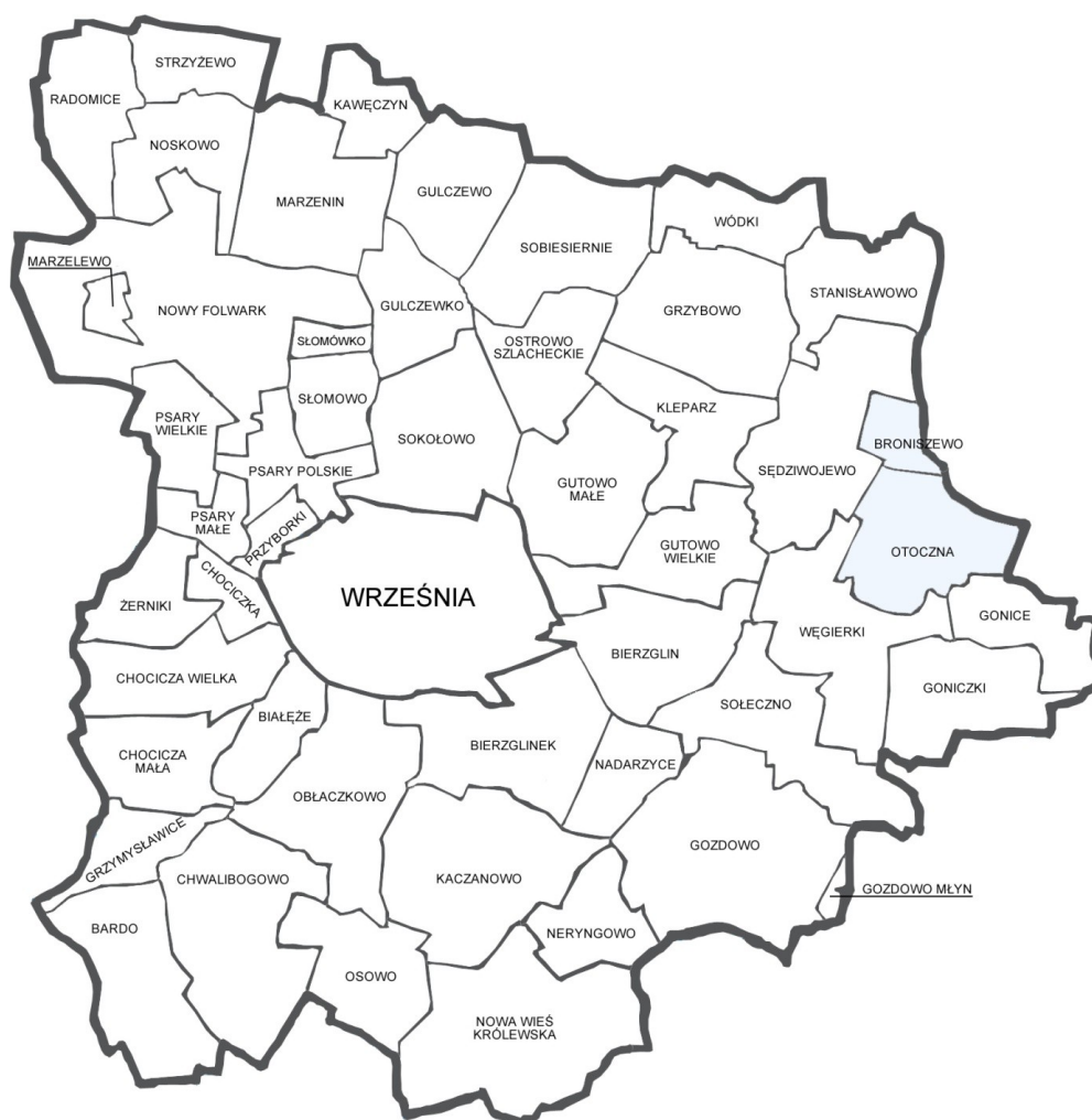
Ryc. 1 Położenie sołectwa Otoczna na tle sąsiadujących gmin

Źródło: opracowanie własne na podstawie http://www.wrzesnia.pl/strona-2477-Place_zabaw_na_terenie_Miasta_i_Gminy_Wrzesnia.html