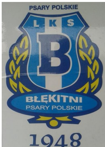
Ryc. 4 Znak drużyny LKS "Błękitni" Psary Polskie