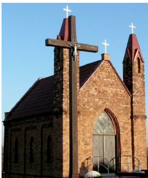
Ryc. 2 Kaplica Matki Boskiej Królowej Świata w Psarach Polskich

system danin i różnych form służebności (np. w formie świadczenia nieodpłatnej pracy na rzecz pana), wokół grodów powstawały tzw. osady służebne. Psary (dawniej Psakowo) najprawdopodobniej również miały taki charakter i zamieszkiwane były przez hodowców psów ("psiarze"). Nie występują we wsi w zasadzie obiekty zabytkowe, poza XIX-wieczną kaplicą Matki Boskiej Królowej Świata, przeniesioną tu w 1970 r. z Zawozia, oraz 6 starych budynków mieszkalnych (nr 91, 92, 98, 124, 125, 126, pochodzące z XIX i pocz. XX wieku).