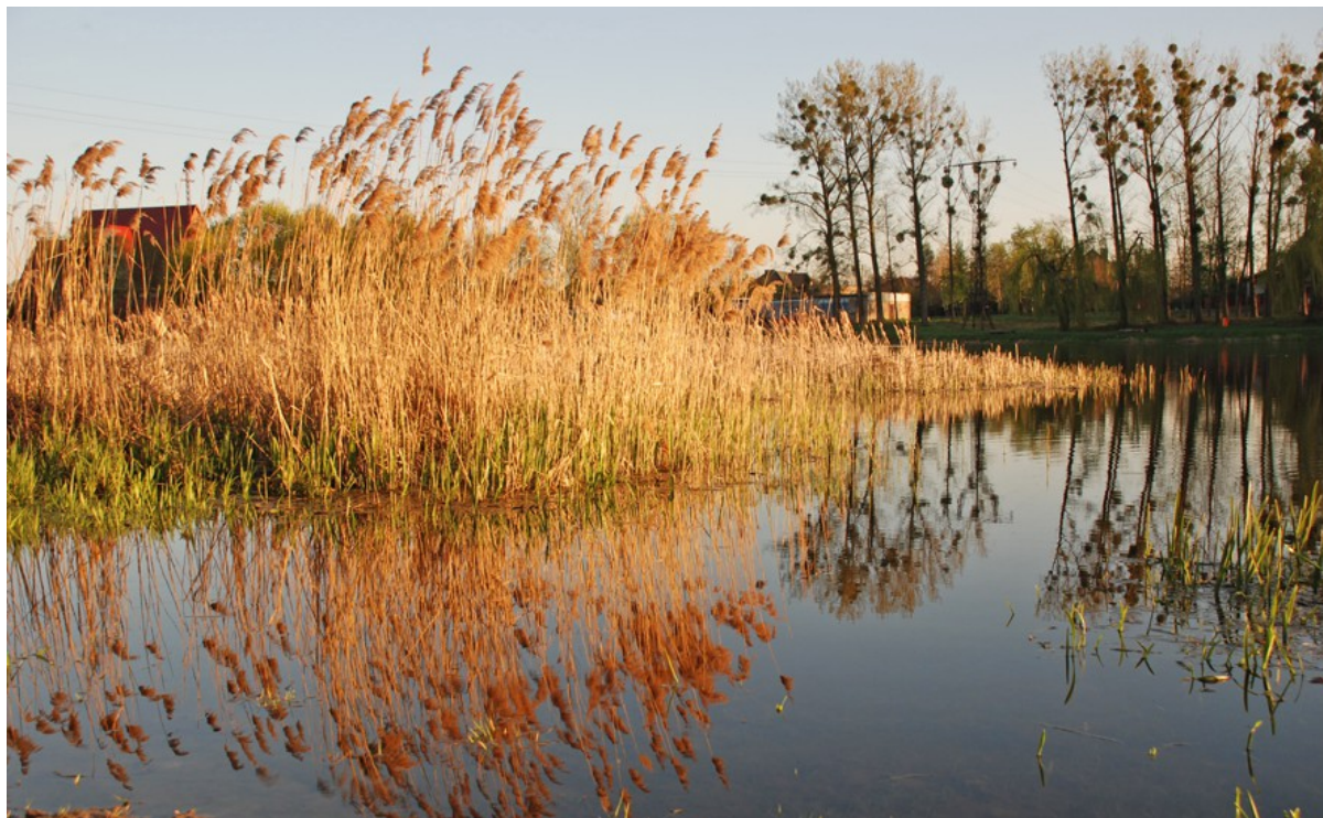
Ryc. 3 Zalew Wrzesiński w Psarach Polskich

We wsi powstaje kanalizacja sanitarna, w dużej części została już także zgazyfikowana. W wodę miejscowość jest zasilana ze Stacji Uzdatniania Wody Nowy Folwark, a także częściowo przez SUW Września. W 2013 r. firma telekomunikacyjna Inea rozpoczęła budowę sieci światłowodowej na terenie Psar Polskich oraz kilku innych miejscowości z gminy Września. Dzięki temu mieszkańcy mogą korzystać z pakietu usług (telefon, internet, telewizja kablowa) u tego samego dostawcy.