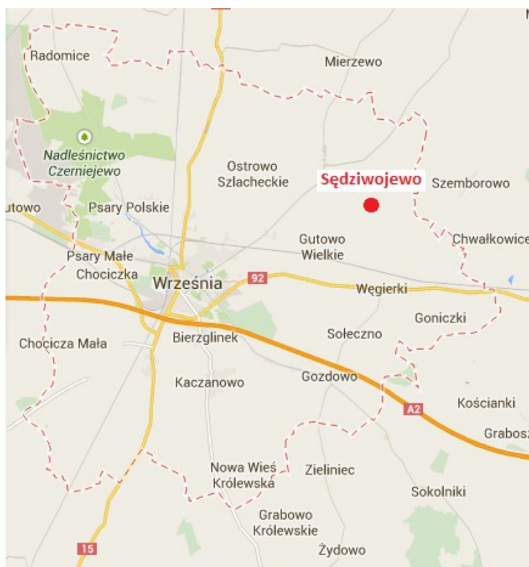
Ryc. 1. Lokalizacja Sędziwojewa w obrębie gminy Września.

Sędziwojowo to wieś sołecka leżąca we wschodniej części gminy Września, w powiecie wrzesińskim, województwie wielkopolskim. Od Wrześni oddalona jest o około 10 km w kierunku północno-wschodnim. O korzystnej lokalizacji miejscowości decyduje bliskość drogi krajowej nr 92 (Poznań-Warszawa) oraz stacji kolejowej (zlokalizowana w sąsiedniej miejscowości – Gutowie Wielkim).