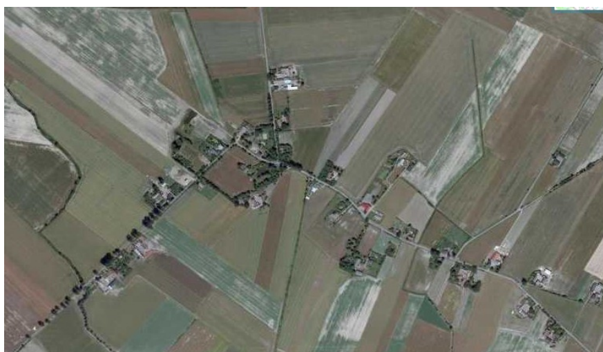
Ryc. 3. Układ przestrzenny Sędziwojowa.

Sędziwojowo zajmuje powierzchnię 735,27 ha. Otoczenie wsi to typowo rolniczy krajobraz. Brak jest terenów leśnych. Prawie 94% powierzchni sołectwa stanowią użytki rolne. Niewielkie skupiska drzew występują w samej wsi, wokół niektórych gospodarstw. W pobliżu głównego skrzyżowania znajduje się dość duży, otoczony drzewami staw przeciwpożarowy. Dominujący udział w gruntach rolnych mają gleby III jakości. W Sędziwojowie przeważa zabudowa zagrodowa o znacznym rozproszeniu.