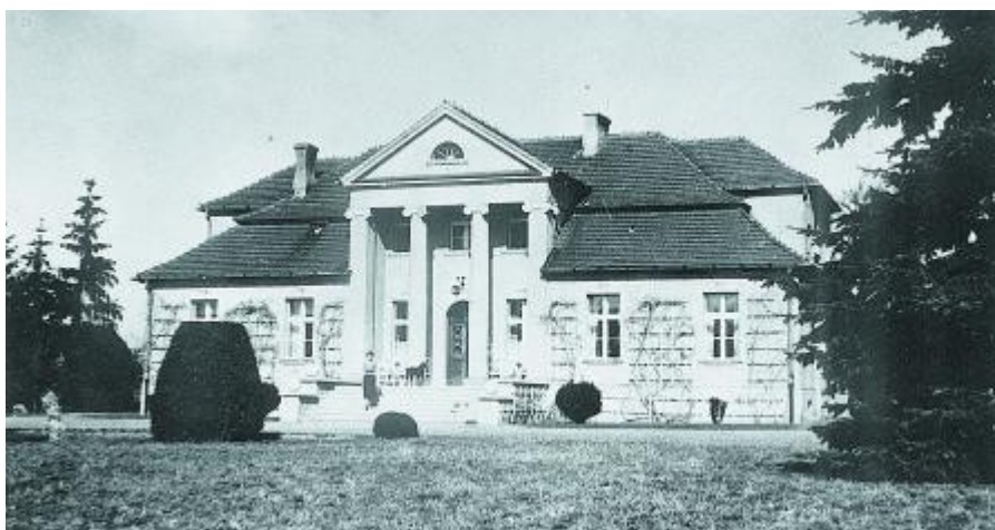
Ryc. 2 Dwór w Wódkach